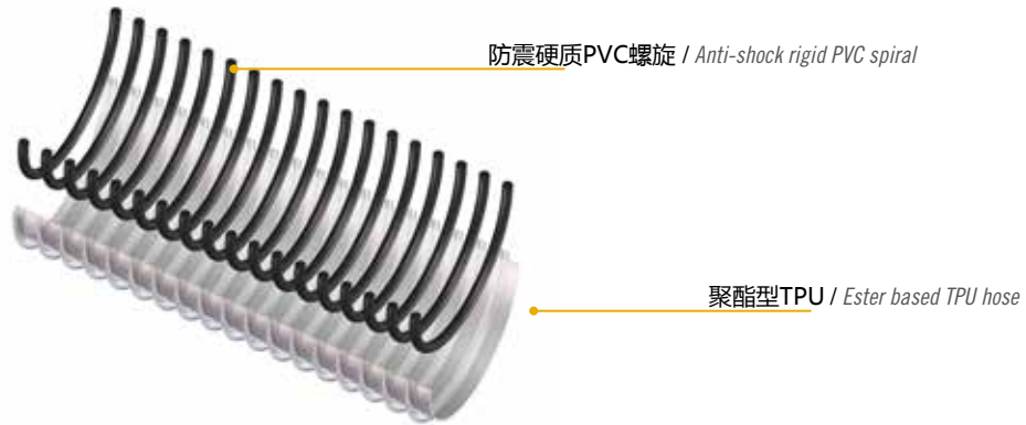
技术参数 / Technical data